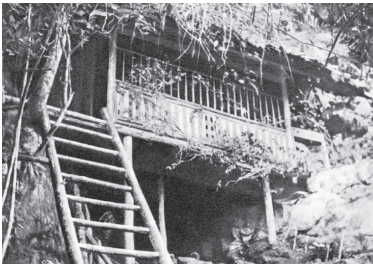
Ngôi nhà sàn đơn sơ, nơi ở và làm việc của Người tại Việt Bắc trong cuộc kháng chiến chống thực dân Pháp