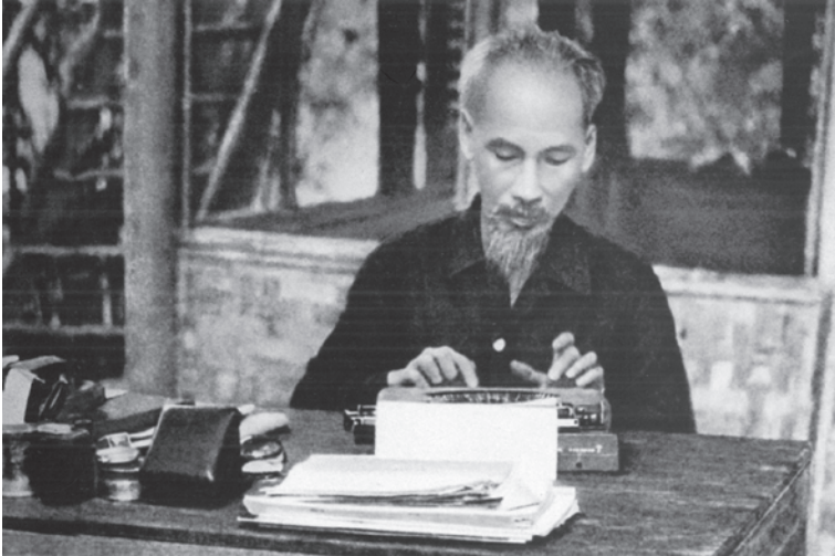
Từ chiếc máy chữ này Người đã soạn thảo nhiều văn kiện quan trọng quan hệ đến vận mệnh của Tổ quốc.

bộ chưa hiểu, cho nên trong lúc làm việc, thường sai lầm; đến nỗi chia cán bộ Chính phủ và Đảng ra làm một phía, quần chúng ra một phía.