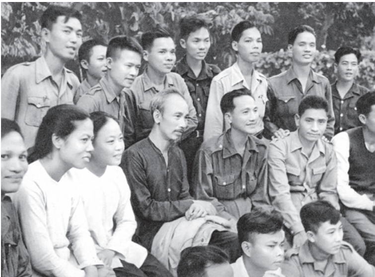
Chủ tịch Hồ Chí Minh với Đoàn đại biểu Nam Bộ từ chiến trường miền Nam ra chiến khu Việt Bắc báo cáo với Trung ương Đảng, Bác Hồ và Chính phủ về quyết tâm kháng chiến của đồng bào và chiến sĩ miền Nam (10-1949).