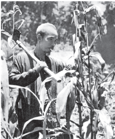
Người dạy: "Thực túc thì bình cường" và ngày ngày Người tặng gia sản xuất